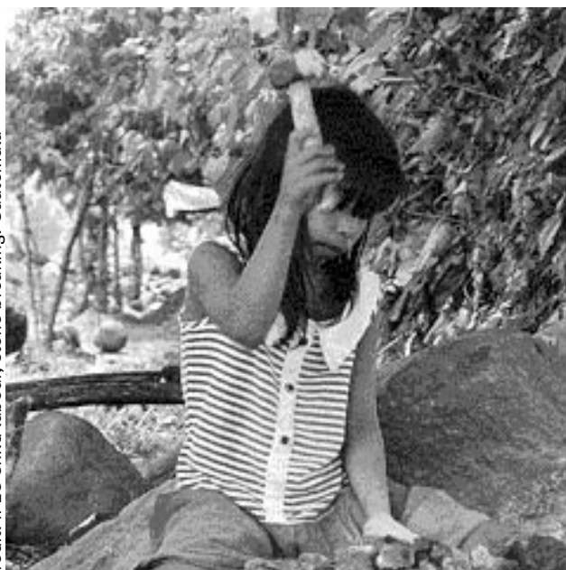
Child labour, stone breaking, Guatemala

Le travail des 500 enfants, qui consiste à concasser des blocs de pierre à Retalhuleu, est certainement l'une des pires formes de travail auquel sont astreints les enfants.