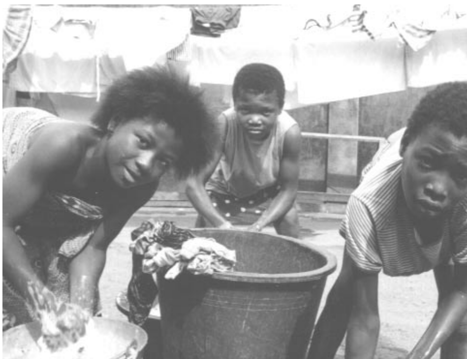
Child domestic workers. Benin.

Pour terminer, le concept d'un parlement des enfants (aux fins) d'examiner et de promouvoir ces questions s'est fait jour au Togo. L'Assemblée nationale togolaise a procédé en septembre 2000) au plan régional à l'élection d'enfants qui participeront au futur parlement des enfants !